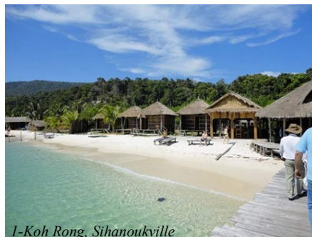
1-Koh Rong, Sihanoukville

En outre, au cours des neuf premiers mois de cette année, la province du nord-est de Kratié a attiré quelque 215.013 touristes, soit une augmentation de 6,35% par rapport à la période correspondante de 2013. AKP