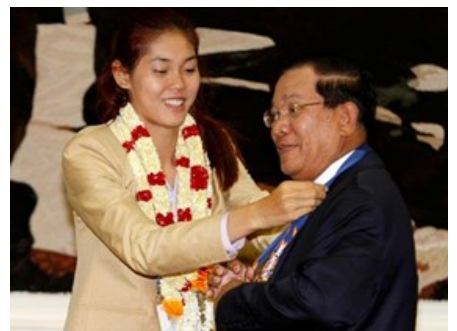
Le Premier Ministre Hun Sen et Sorn Seavmey

Âgée de 19 ans, Sorn Seavmey, a battu 7-4 son homologue iranienne Rouhani Fatemeh dans l'épreuve féminine des moins de 73 kg, selon le Comité national olympique du Cambodge (CNOC).