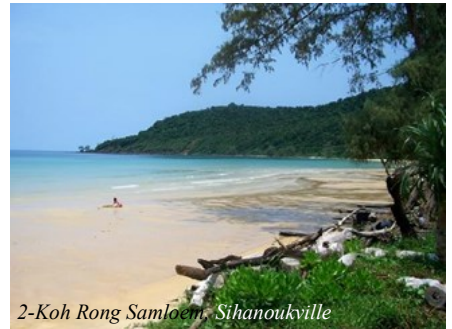
2-Koh Rong Samloem, Sihanoukville

de plus en plus populaires parmi les touristes étrangers au cours des dernières années.